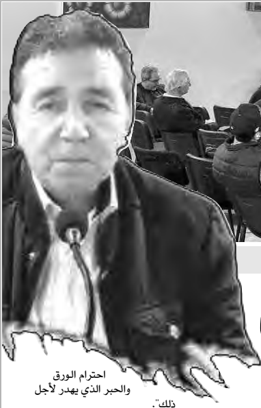
احترام الورق والجبر الذي يهدد لأجل ذلك.

أشار الكاتب أيضا، إلى أنه يفضل الموضوعات الكبرى والاتساق (خاصة في كتاباته)، منها مثلا، اعتبار الذئب أو الفأر أو الحمار في النصوص "شخصيات" إيجابية وزئبية وعفيفة، عكس بعض البشر الذين يظلمون هذه المخلوقات وينسون أنفسهم، كما أكد المتحدث، أن بعض هذه الحيوانات توظف في الكتابة في إطار ساخر، فمثلا نهيق الحمار يعني أنه رأى منكرا، أي فاسدا، وهكذا، مشيرا أيضا، إلى أن الواقعية لا تعبر وحدها عن كل الأحداث والمشاعر، لكن بوطاجين أوضح أنه لا يلجأ فيما يكتب للعبث.