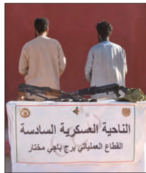
أخرى، في حين أوقفت مفارز للجيش الوطني الشعبي 15 عنصر دعم للجماعات الإرهابية خلال عمليات متفرقة عبر التراب الوطني. "محاكمة الجريمة المنظمة ومواصل للجهود الحثيئة الهادفة إلى التصدي لآفة الاتجار بالمخدرات