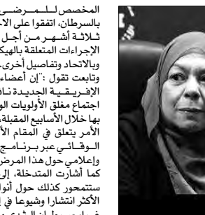
مشتلي البيلان الإفريقية 14 المشاركة في المؤتمر الدولي الأول

بالسرطان، اتفقا على الاجتماع خلال ثلاثة أشهر من أجل استكمال الإجراءات المتعلقة بالهيكلة التنظيمية وبالتحديد تفاصيل أخرى. وتابعت تقول: "إن أعضاء هذه الهيئة الإفريقية الجديدة ناقشوا عقب اجتماع مغلق الأولويات الواجب القيام بها خلال الأسابيع المقبلة، موضحة أن الأمر يتعلق في المقام الأول بالجناب الوقائي عبر برنامج تحسيسي وإعلامي حول هذا المرض". كما أشارت المتخلة، إلى أن الجهود ستستمر كذلك حول أنواع السرطان الأكثر انتشارا وضيوعا في إفريقيا. غرار سرطان الثدي والبروستات والقولون، مضيفة أن الأولوية الثانية تتعلق بتكوين الممارسين المتدخلين في