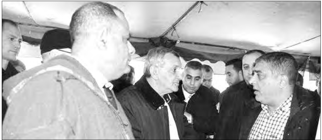
المجتمع المدني يرفع انشغالاته إلى والي سكيكدة