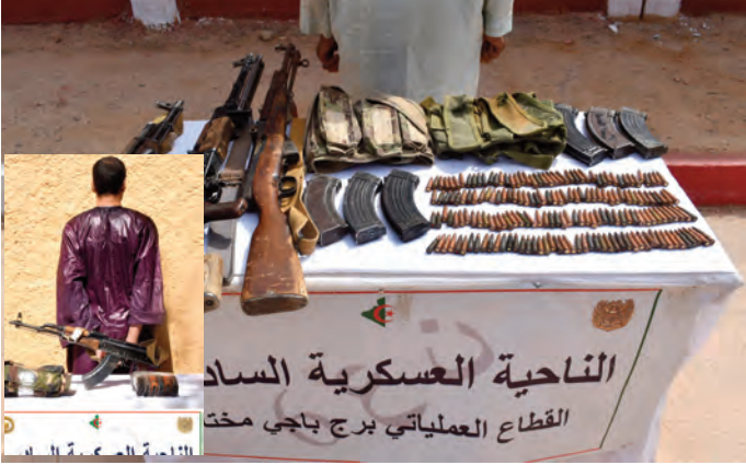
الناحية العسكرية السادسة القطاع العملياني برج باجي مخت

تمكن عناصر الجيش الوطني الشعبي، في عمليات متفرقة تم تنفيذها خلال فيفري المنصرم، من القضاء على إرهابي وتوقيف 37 عنصر دعم للجماعات الإرهابية، فيما سلم أربعة إرهابيين أنفسهم للسلطات العسكرية، واسترجاع كمية معتبرة من الأسلحة، حسبما أوردته أمس حصىلة عملياتية للجيش الوطني الشعبي.