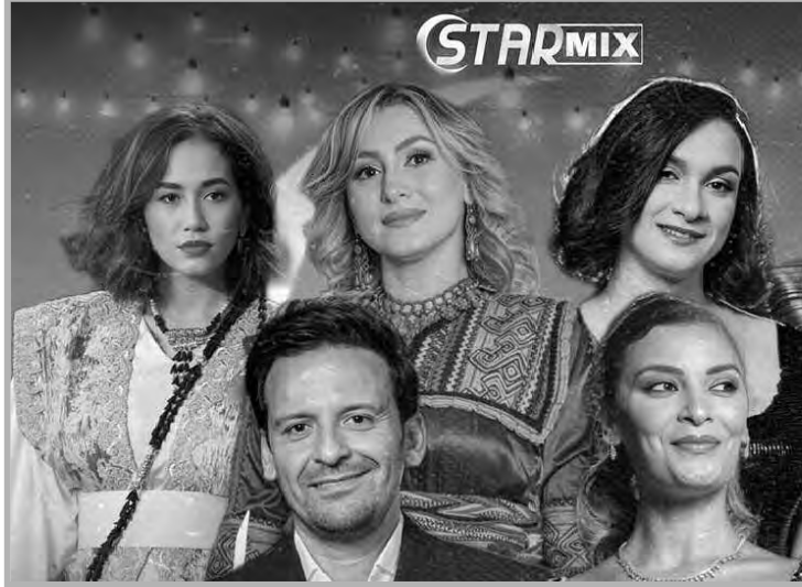
يعد مسلسل "فراق" للمخرج يوسف محساس، واحداً من أبرز الأعمال الدرامية الاجتماعية التي استطاعت أن تسلط الضوء على التحديات اليومية التي يواجهها الأزواج في المجتمع الجزائري، حيث يعرض قضايا العلاقات الزوجية من زاوية جديدة، تتشابك فيها الخيانة، والغدر، والتم، والمشاعر الإنسانية المتنوعة، في إطار عائلي، مشحون بالمشاعر المتضاربة.

العمل لا يقتصر، فقط، على قصة مثيرة، فحسب، بل يشمل، أيضاً، أداء تمثيالي قويًا من قبل طاقم العمل، إذ نجح كل الممثلين في تجسيد مشاعر شخصياتهم بشكل صادق وواقعي، ما يجعل المسلسل أكثر تأثيراً على المشاهد.