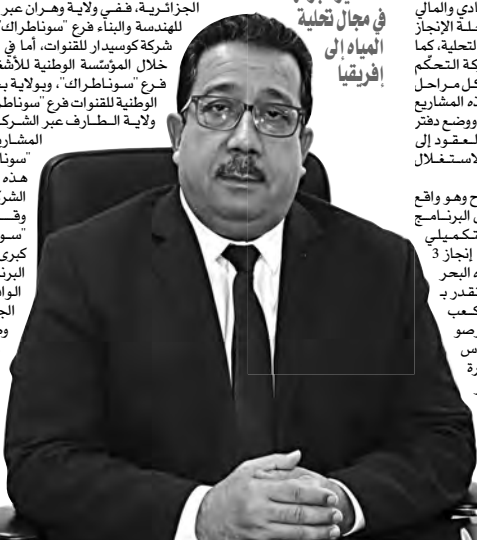
مدير "الجزائرية للطاقة" يكشف "المساء" تفاصيل مصانع الطاقة الستة الجديدة

أوضح الرئيس المدير العام للشركة الجزائرية للطاقة، فرع سوناطراك، في حوار "المساء" أن الشركة اكتسبت خبرة واسعة في صناعة تحلية مياه البحر، بداية من الإشراف على المشاريع وتطويرها مروراً بوضع النموذج الاقتصادي والمالي لها، وصولاً إلى إنجاز واستغلال مصانع التحلية، والتحكم في كل مراحل تطوير المشاريع من اتخاذ القرار ووضع دفتر الشروط وإبرام العقود إلى غاية الاستغلال والصيانة، كما استند اعتماد مجمع سوناطراك عبر "الجزائرية للطاقة" والشركات المنجزة لبرنامج محطات التحلية الخمسة الكبرى، سياسة إدماج وطنية كأولوية مطلقة وصلت إلى نسبة 30٪ عبر استخدام المنتج الجزائري المطابق للمعايير الدولية.