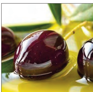
الممتاز المستخلص بمصصرة "بوحلوف" الحسي المكونة من خبراء