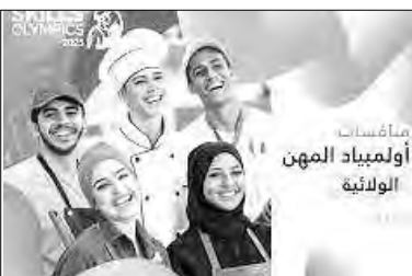
مسابقات أولمبياد المهن الولاية

الفلاحة والبناء والأشغال العمومية والسياحة والإلكترونيك، ممثلين لـ 21 مؤسسة تكوينية. ويشرف على تقييم الأعمال المشاركة في هذه المنافسات، المؤهلة للبطولة الوطنية للأولمبياد، المرتقب تنظيمها في شهر نوفمبر المقبل، لجنة تحكيم تضم 90 حكما، 60 منهم ممثلين للشريك الاقتصادي، و30 من أساتذة القطاع، وفقا لنفس المسؤول. وتتميز هذه المنافسات، بإعداد أو صيانة المشارك للخدمة أو المنتج المقترح بعين المكان، في مختلف المجالات كالإلكترونيك والصناعية وتركيب وتصليح النظارات الطبية والصيانة الصناعية والفلاحة وتربية الحيوانات والفنون