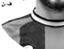
ف. ن هدف دييغو

أرماتونو مارادونا الشهير أمام إنجلترا في مونديال 1986، أو بلك التي سجل منها ميسي هدفه الخرافي أمام خيتا في سنة 2007، والذي جعله يحصل على لقب جديد في الأرجنتين. وافتح سعيود باب التسجيل لفريقه الرائد في دربي القصيم أمام نادي التعاون، عن طريق ركلة جزاء في الدقيقة 22، كما قدم تمريرة حاسمة سجل منها زميله الكاميروني عمر غونزاليس الهدف الثالث لفريقه، في مواجهة حسنها التعاون، بنتيجة (3-0)، ليرفع رصيده إلى 41 نقطة في المركز السابع، فيما تجدد رصيده الرائد بنتيجة 21 نقطة في المركز الأخير.