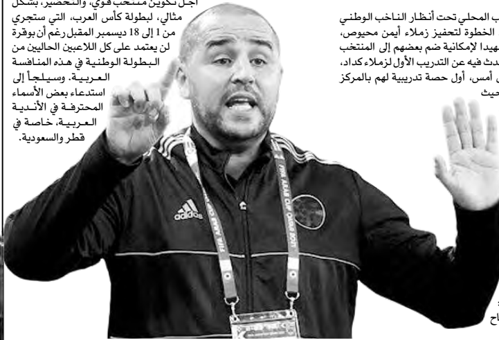
مرشح للتنافس على جائزة "بوشكاش" العالمية