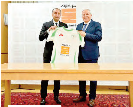
الاتحادية الرياضية للمنتخب الجزائريين