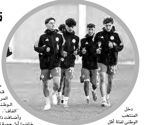
دخل المنتخب الوطني لفئة أقل من 20 سنة، أول أمس، في

وأضافت ذات الهيئة الكروية، أن "الخضر" خاضوا أول حصص تدريبية لهم في البرنامج، أول أمس، بحضور النجم الدولي الأسبق كريم زياتي. للتذكير، تم تخصيص الترتيب الأول الذي جرى من 16 إلى 20 أبريل الماضي، للاعبي مواليد 2006، حيث تم استدعاء 32 لاعبا ينشطون في مختلف الأندية المحلية، ويسعى المدرب الوطني زريق نيدر من خلال هذه المعسكرات التحضيرية، لتقييم اللاعبين عن