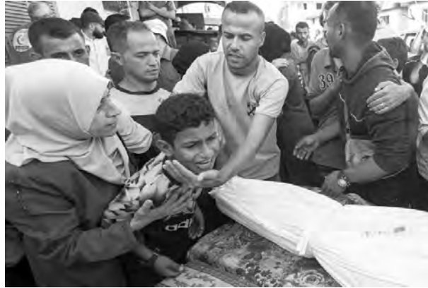
أبو عبيدة يعلن الإفراج عن جندي صهيوني يحمل الجنسية الأمريكية

ارتكب جيش الاحتلال الصهيوني في الساعات الأولى من صباح أمس، مجزرة مروعة جديدة في قطاع غزة باستهداف طيرانه الحربي لمدرسة "فاطمة" بمدينة جباليا البلد الواقعة إلى الشمال والتي كانت تاوي نازحين غالبيتهم من الأطفال والنساء العزل.