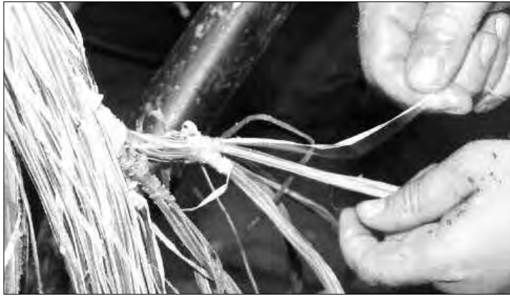
سرقات متكررة بحج مرج الذيب

وأغلبية البالوعات، ناهيك عن انتشار ظاهرة ترويع المخدرات والمهلوسات، وأبدى السكان مخاوف حقيقية أمام تفاقم الظاهرة على مستوى هذا الحي، الذي أصبح يعيش تحت رحمة اللصوص والمنعرجين، مستغلين بذلك انعدام الإنارة العمومية منذ أكثر من 4 أشهر، ما جعلهم يحلمون مصالح البلدية مسؤولية تدني الأوضاع، وزادهم قلقا وغضباً، تأخر عملية إعادة تعيد الطرقات الرئيسية والفرعية للحي، وكذا تجديد مساحات اللعب وتغطية البالوعات... وغيرها.