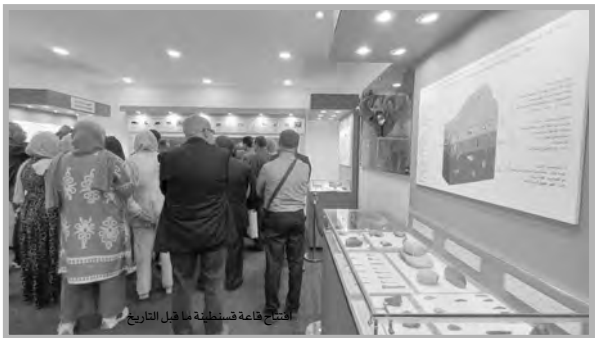
افتتاح قاعة قسنطينة ما قبل التاريخ