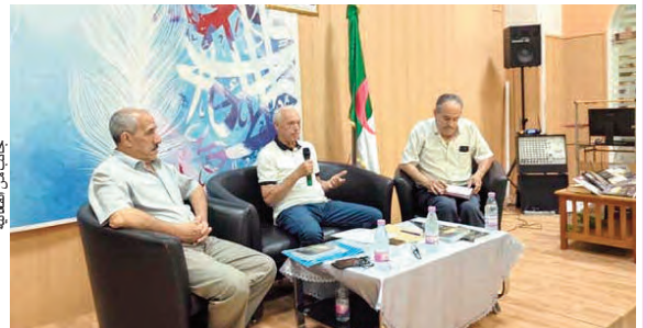
جانب من ضيافة الحرف