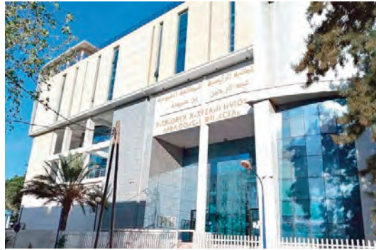
مكتبة المخطوطات العجمية ببومرداس

الإجابة عن التساؤل: "هل هذا التراث مؤهل فعليا لترقيم باستخدام الذكاء الاصطناعي؟". ورغم اعترافه بأهمية التطور التكنولوجي في حديقته إلى "المساء" على هامش هذه الندوة، على أن الحماية الحسية تبقى الأهم، من خلال الترميم، والصيانة المستمرة، وتخصيص متاحف مجهزة بالشروط الصحية الملائمة، لحفظ اللقى الأثرية من تأثيرات الزمن والطبيعة. أما الحماية الرقمية فراها دعما مكمل للحماية الميدانية. وعن مشروع رقمته اللقى الأثرية المنقولة الموجودة بمتحف "سيدي الحرفي" في قصبه دلس، أوضح أنه لم يُنقذ ميدان بعد، وإنما تم التطرق له كمسألة مستقبلية، يحتاج إلى ترخيص من الجهات الوصية، وكذا دعم بجهاز المصور الهوائي أو الدرون: لحماية رقمية لللقى الأثرية لمتحف سيدي الحرفي. ورأى المتحدث المنجز في هذا الصدد، تمهيدا، وخطة تاطيرية أول نحو تحقيق حماية رقمية فعلية، كما أشار إلى تجربة معمارية، زميلة اقترحت رقمته الجدار الروماني بدلس، وتمكنت من إعادة تصويره رقميا انطلاقا من الإحداثيات المكانية وبقي الأثار، مؤكدا أهمية دعم هذه المخطوطات وتحولها إلى عمل تقني ميداني. وأكد في الختام أن رقمته التراث في ولاية بومرداس، ليست مجرد عملية تقنية، بل هي مشروع ثقافي طويل المدى، يتطلب تضافر جهود جميع الفاعلين من مؤسسات الدولة، والجامعات، والمجتمع المدني، إلى جانب توفير الوسائل والمؤسسات الأكاديمية وكذا المجتمع المدني، مع توفير الوسائل الكفيلة بتحويل هذا التحدي إلى فرصة لصون التراث المحلي، وجعله متاحا للعالم الرقمي.