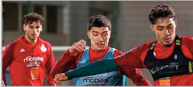
السويدي يوم 10 جوان.