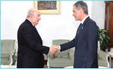
الرئيس تبون يستقبل الرئيس المدير العام لـ"سي أم - سي جي أم"