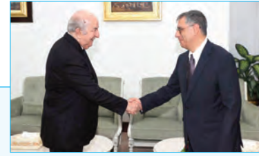
استقبله رئيس الجمهورية.. سفير الشيلي: