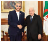
استقبل رئيس الجمهورية، السيد عبد المجيد تبون، أمس الاثنين، الفنان الجزائري العالمي وليم قريفا حسين، الملقب بـ "Snake".