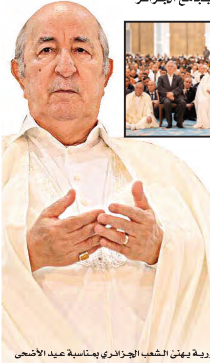
رئيس الجمهورية يهنئ الشعب الجزائري بمناسبة عيد الأضحى