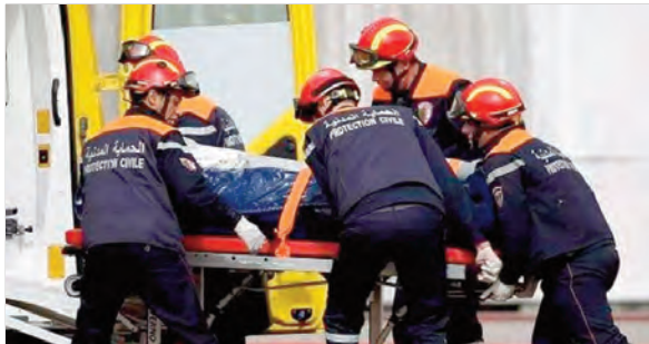
حملات جوارية لمواجهة "القاتل الصامت"

وفي إطار جهوده للحد من الحوادث المنزلية الناتجة عن تسربات غاز أحادي أكسيد الكربون، كشفت المديرية من نشاطها الميداني نهاية الأسبوع الماضي، من خلال تنظيم حملة جوارية استهدفت 414 مسكن اجتماعيا بالوحدة الجوارية 20، حيث باشر أعوان الحماية المدنية طرق الأبواب للتواصل مباشرة مع ربات البيوت، وتقديم إرشادات دقيقة حول الاستعمال الآمن للغاز الطبيعي داخل المنازل. وشملت هذه العملية التجسييسية، حسب مسؤولي الإعلام، تقديم نصائح وقائية بشأن صيانة كواشف الغاز أحادي أكسيد الكربون، إلى جانب توزيع طوابع توجيهية، تتضمن جملة من التدابير الواجب اتباعها، لتفادي مخاطر هذا الغاز القاتل، في سياق