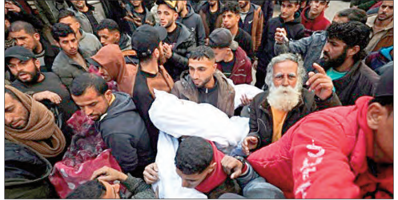
بالقطاع نحو خافة الانهيار.

وفي منشور عبر حسابه الرسمي على منصات التواصل الاجتماعي، أوضح المدير العام للمنظمة، أنه "لأكثر من 100 يوم يدخل الوقود إلى قطاع غزة، كما رفض الاحتلال محاولات استعادة مخزون الوقود من مناطق الإخلاء ما يدفع النظام الصهيوني نحو خافة الانهيار".