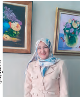
الفنانة من راجاتها

أبدعت الفنانة إلى حد بعيد، في رسم باقات الورد والزهور وفي المزهرجات، مستعمدة على الألوان وعلى الخلفيات التي زادت سحرا، حيث تضمنت أحداها خلفية سوداء، انعكس لونها على اللوحة. قدمت الفنانة في معرضها 20 لوحة، تبرز فيها الطبيعة واللباس التقليدي، وكذا المواقف الشوق والحنين لهذا الماضي الجميل، ثم أضافت "وبما أنني ابنة مدينة الورد، حرصت على أن أنثر الورد والزهر في أغلب لوحاتي، منها لوحات الطبيعة الممتدة، مثلا، كذلك في لوحة الخط العربي ذي الزخرفة الإسلامية، بخط الثلث والديواني، كتبت به آية قرآنية كريمة، برزت فيها تقنية التذهيب والتذهيب الجميل، وهي مطلوبة ومحبوكة من الجمهور".