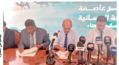
جانب من التظاهرة