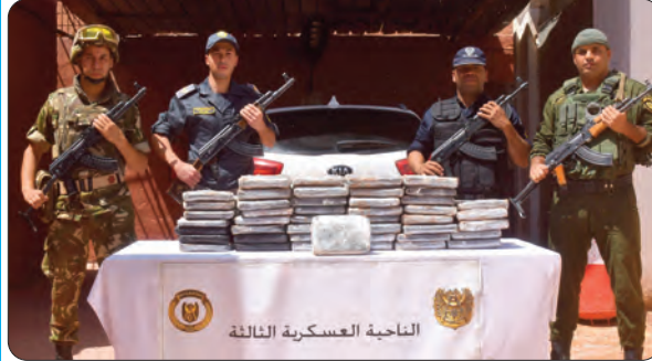
الناحية العسكرية الثالثة

■ إحياء محاولات إدخال 3 قناطر و41 كلف من الكيف المغربي ■ حجز 91 كلف من الكوكايين و1.453.577 قرص مهلوس