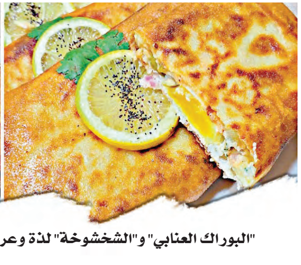
"البوراك العنابي" و"الشخشوخة" لذة وعراقة