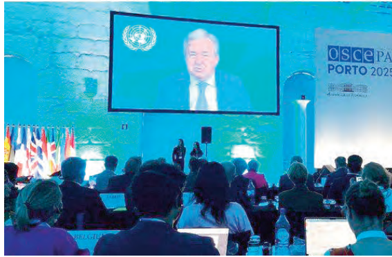
الدولي الإنساني، معربا-حسب البيان-عن ارتياحه لروح الانفتاح التي طبعها هذه الاجتماعات والتي تتيح للوفود الملاحظة فرصة الاطلاع على التجارب البرلمانية

وتطوّر مواقف الدول المشاركة إزاء التحديات الإقليمية والعالمية الراهنة في أفق بناء تعاون أكثر توازنا وشمولية. وأشار البيان إلى أن أشغال الدورة في يومها الثالث شهدت مواصلة الاجتماعات المتخصصة للجان العامة، لاسيما لجنة الشؤون السياسية والأمن، ولجنة الشؤون الاقتصادية والبيئية، ولجنة الديمقراطية وحقوق الإنسان، حيث تناولت "مختلف التحديات الإقليمية والدولية التي تواجه الدول الأعضاء بما في ذلك قضايا السلام وحقوق الإنسان، والأمن الطاقوي وأثر التغيرات المناخية". ويواصل الوفد الجزائري حضوره طيلة ما تبقى من الدورة - التي تجري فعالياتها من 29 جوان إلى 3 جويلية - في إطار "تعزيز انخراط الجزائر في المنظمات متعددة الأطراف وتكريس دورها كفاعل مسؤول في دعم الحوار، والتعاون، والسلم على المستويين الإقليمي والدولي".