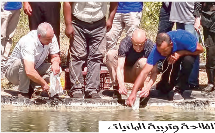
نموذج متكامل بين الفلاحة وتربية المائيات