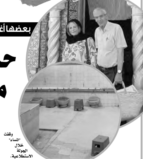
تشكل الحمامات جزءاً كبيراً من الحياة اليومية لسكان مدينة الورد، ولا تزال شاهدة على عراقة وأصالة ناس "الوريدة"، فإلى جانب كونها تمتد إلى العهد التركي، كانت ولا تزال مكاناً مفضلاً للراغبات في البحث عن فتيات لخطبتهن، حيث كانت هذه المهمة تلقى على عاتق الأم، التي تزور الحمام من أجل التجمعة، وتبحث عن عروس لزوجها، بعدها تقترب منها لتعرف على اسم عائلتها، حيث كانت العائلات العريقة تأخذ تسميتها من الصنعة، التي يشتهر بها والدها، وبعدها تزور البيت وتطلب خطبة الفتاة.

من أكثر الأمور التي تسألتنا عليها، أنه لم يتسن لنا دخول عدد كبير من الحمامات، التي وجدناها مغلقة، مثل حمام "سيدي عبد الله"، الذي يعود إلى سنة 1818، و"حمام ميخي"، و"حمام القاضي"، ليس لأن أصحابها في عطلة أو أن ساعات العمل لم تبدأ بعد، إذ أن هذه الحمامات، حسب شهادة الساكنة، تحبباً نشاطها مكرراً، حيث تخصص الفترات الصباحية للنساء إلى غاية موعد العصر، ليتم إزالة الفوط التي تعلق على الجباب، وتعتبر إلى أن هذا الوقت مخصص للنساء، بعدها يبدأ موعد دخول الرجال، ويمتد إلى ما بعد