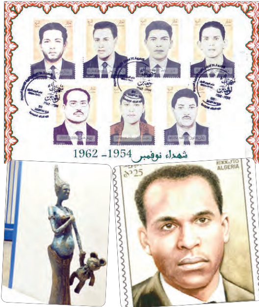
شهداء نوفمبر 1954-1962