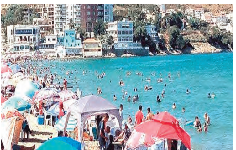
الواجهة البحرية الجديدة لمدينة وهران

محمد عبيد أما كريم فإن إن هذا الجور أضف ديناميكية جديدة على عاصمة القرب الجزائر، ومنح سوية أكبر لجهة الشاحات من وإلى البناء. كما يتيح استعماله الطريق ربح الوقت، وتفاذي الأزدحام المروري خصوصا في موسم الاصطيف، إلا أنه فتح فسحة سياحية، وإطلالة بانورامية أكثر جاذبية. للإشارة، يشمل هذا الطريق الذي أنجز بأحدث التقنيات، خمس منشآت فنية، منها نفق ذو منفذان على طول 930 متر، وآخر بطول 1580 متر، وجسر بطول 680 متر، وكذا طريق آخر بمحاذاة البحر، وطريق سيار. كما تم ضمن نفس المشروع إعادة تأهيل طريق "الجواقي"، ما سيج إضفاء صبغة جمالية على الواجهة البحرية.