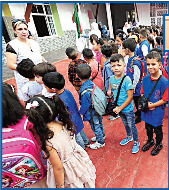
تدابير الوقاية الجديدة ساهمت في تراجع المساحات المتضررة

وأعلن الوزير في هذا الصدد عن اقتناء 300 موزع آلي التقود سيتم نشرها قريبا عبر التراب الوطني، حيث ينظر من خلالها فتح فضاء حرمض أربع موزعات آلية بلدية المشروعة تعمل على مدار 24 ساعة، فضلا عن نشر هذه الموزعات كذلك عبر باقي بلديات وودوار الولاية. كما أكد الوزير، وفقا للوزير، اقتناء أيضا 700 موزع آلي للتقود مزودة بخاصية الدفع والسحب الآلي للتقود، وذلك ضمن إستراتيجية تعميم الموزعات الآلية عبر كافة فضاءات بريد الجزائر والتي يولي لها القطاع أهمية قصوى. كما شدد