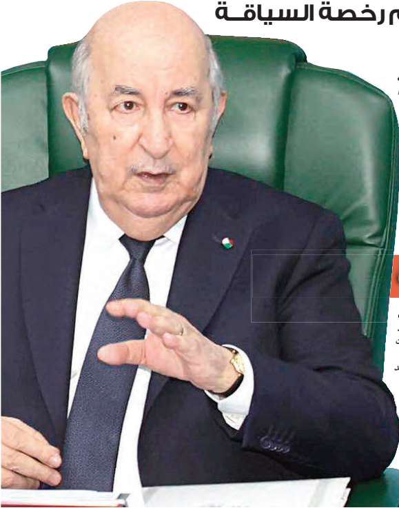
بعد دعوة الوزير الأول النواب للاختبار بين الفوضى أو المسؤولية