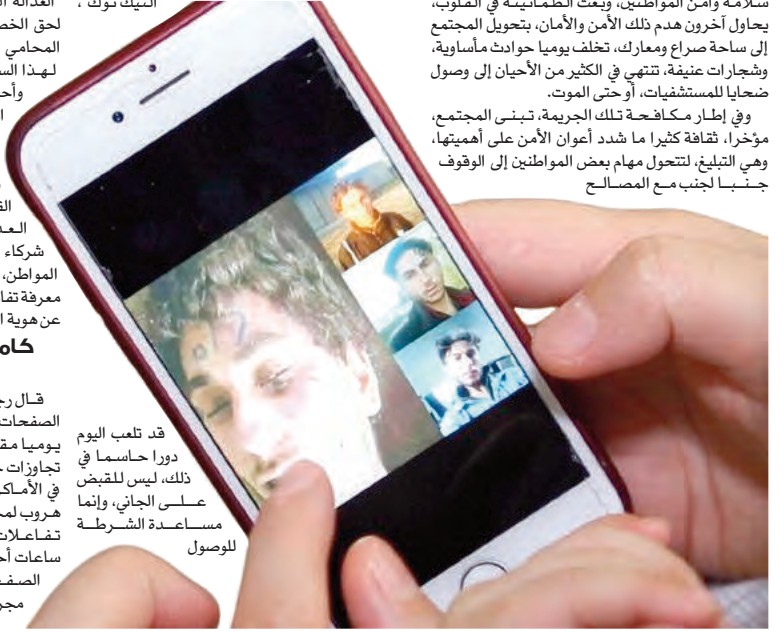
قد تلعب اليوم دورا حاسما في ذلك، ليس للتبليغ على الجاني، وإنما مساعدا للشرطة للوقوف

وفي إطار مكافحة تلك الجريمة، تبني المجتمع، مؤخرا، ثقافة كثيرا ما شد أعوان الأمن على أهميتها، وهي التبليغ، لتلحوق مهام بعض المواطنين إلى الوقوف جنبنا لجنب مع المصالح