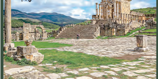
في أ. م