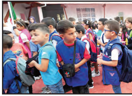
تهيئة كل الظروف لالتحاق التلاميذ بمدارسهم

وستعرف ولاية بجاية على غرار باقي ولايات الوطن تسلم هياكل تربوية جديدة بمناسبة الدخول المدرسي لسنة الدراسية، حيث تسلم 8 مجمعات مدرسية، و73 قسم توسعة، و6 مطاعم مدرسية، وثلاث متوسطات وثانوية، فيما أنهت أغلب البلديات عملية الترميم التي مست بعض المدارس الابتدائية، لتكون في أفضل الظروف لاستقبال التلاميذ. وقد اتخذت كافة التدابير اللازمة لتفادي أي تأخر يخوض افتتاح أبوابها، كما قامت ببلدية آقبو، من جهتها، بإشغال ترميم على مستوى إحدى المتوسطات، التي كان يعاني فيها التلاميذ من خطر مادة الأمونيت؛ حيث تم ترميمها وفق المعايير الحديثة، وتزويدها بكل الوسائل المادية اللازمة، على غرار التدفئة، والمرافق الرياضية، فيما تم تسجيل بعض التأخر في بعض البلديات بخصوص الأشغال التي لازال متواصلة بالمؤسسات التعليمية. الحسن حامة