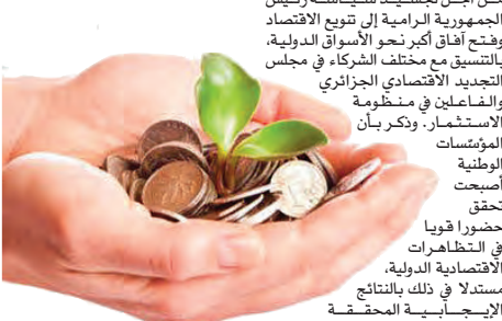
إطلاق "بورصة الشركاء" لوكالة الجزائرية لترقية الاستثمار