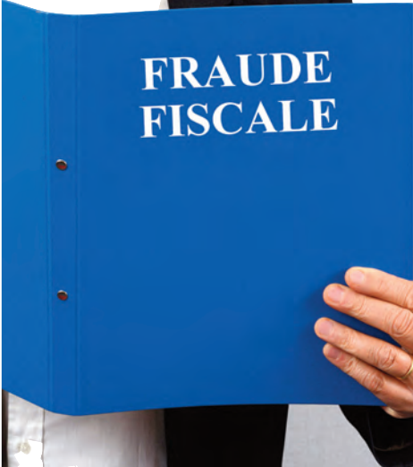
اعتبر مراقبتها في عملية التجسيد التحدي الأكبر للوكالة.. ركاش،

شبكة للتحليل الآلي للمخاطر قيد الإعداد لدى المديرية العامة للضرائب ■ الأولوية للأنشطة المشبوهة خاصة المرتبطة بالتجارة الخارجية ■ التركيز على طبيعة النشاط الممارس وأهميته ومكانته في السوق ■ الاعتماد على معيار مستوى المعيشة والثروة للمالك والمسير أو الشركاء ■ استغلال الثغرات الموجودة في السجل التجاري الرئيسي أو في السجلات الثانوية ■ استعمال نشاط "واجهة" لإخفاء النشاط الرئيسي وتحويله لمؤسسات ثانوية ■ التغيير المتكرر لمكان النشاط أو أنظمة الشركة التي قد تخفي نوايا احتيالية