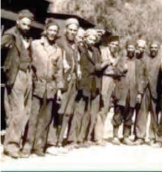
عائل منجم زكار