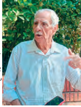
عباس الكبير بن يوسف