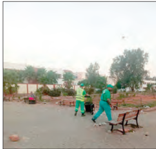
الأشغال على قدم وساق

"السبت" لحملات التنظيف من جهة أخرى، أكد سكان حي 3216 مسكن بأولاد شبل، أن مصالح البلدية تقوم، تنفيذًا لتوجيهات الوالي المنتدب للمقاطعة الإدارية ببئر توتة، المتضمنة تنظيم عمليات نظافة بالأحياء السكنية التابعة لبلديات المقاطعة الإدارية، كل يوم "سبت"، بعمليات نظافة ضخمة، من خلال تسخير الوسائل المادية والبشرية اللازمة. وتعرف هذه الحملات، استجابة واسعة من قبل المجتمع المدني أيضا، حيث أكد البعض أن النظافة تعد ضمن الأولويات، وعلى السكان احترام مواعيد إخراج النظائيات وعدم رميها عشوائيا على مستوى الأرصفة والبالوعات، للحفاظ على نظافة المحيط.