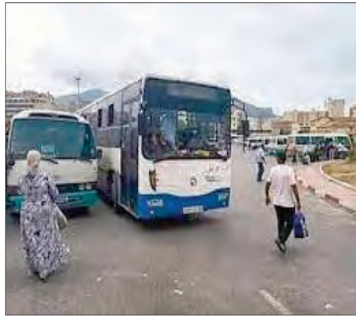
تطوير العقار الفلاحي