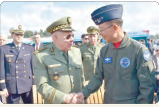
الفريق أول شقريحة يحضر استعراضا جويًا بمعرض سيول

تحديث المنظومات الدفاعية ودعم القدرات الوطنية