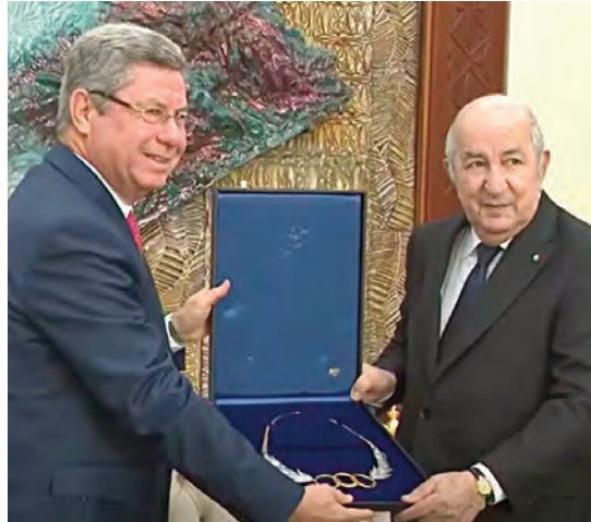
رئيس الجمهورية من اهتمام للشباب والرياضة... كما جاء تكريم رئيس الجمهورية نظير الامتياز التنظيمي للتظاهرات الرياضية الدولية التي احتضنتها الجزائر تحت إشرافه وكذا لسياسته المنهجية في تشجيع الرياضي والحرارة الرياضية عامة من النخبة إلى النوادي والمدارس والجامعات.

• إشادة بحرص السيد الرئيس على إنجاز الألعاب المتوسطية بوهران في 2022