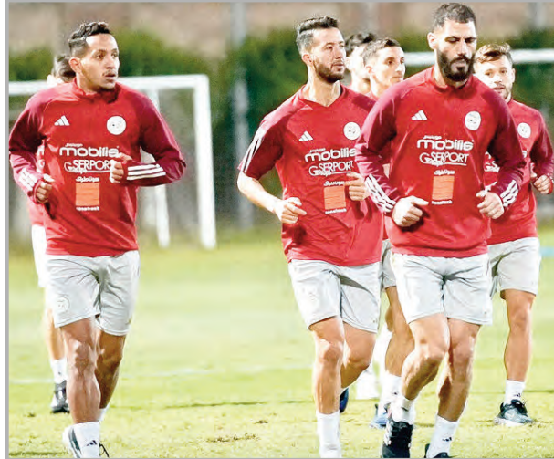
بمواجهة منتخب البحرين يوم السبت القادم 6 من شهر ديسمبر بملعب "خليفة الدولي"، ليختم أشبال مجيد بوقرة دور المجموعات للنسخة الـ 11، من بطولة كأس العرب يوم الثلاثاء 9 ديسمبر القادم، بمواجهة منتخب العراق، ويتأهل الأولان عن كل مجموعة للدور ربع النهائي.