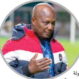
بمواجهة منتخب البحرين يوم السبت القادم 6 من شهر ديسمبر بملعب "خليفة الدولي"، ليختم أشبال مجيد بوقرة دور المجموعات للنسخة الـ 11، من بطولة كأس العرب يوم الثلاثاء 9 ديسمبر القادم، بمواجهة منتخب العراق، ويتأهل الأولان عن كل مجموعة للدور ربع النهائي.