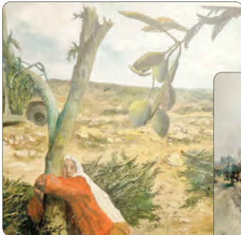
لوحة وتد الزيتون