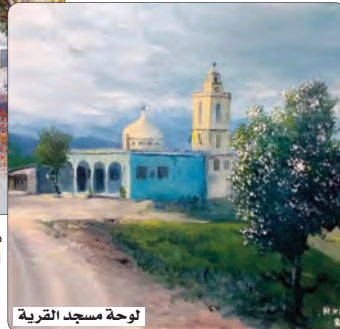
لوحة مسجد القرية

ووصف الفنان اللوحة بكونها استراحة لونية من صخب الألوان؛ فالأبيض سلام وهدهو، وربط ذلك بالأرض التي تغور بالأحداث والنار والدم، ثم تهدأ لتداوي الجراح بذلك البرد والسلام.