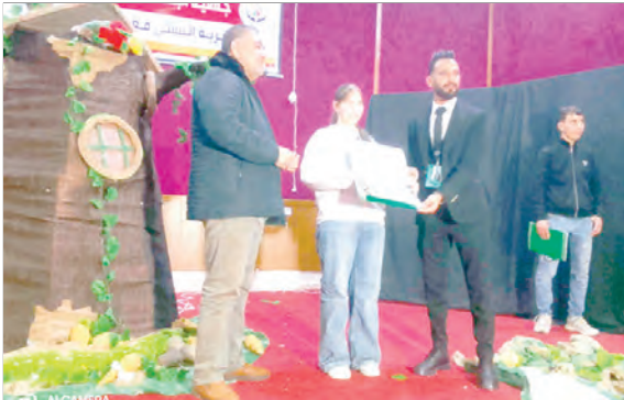
والفنية الهادئة التي كسرت الروتين الممل لاسيما، وأن هذه التظاهرة الثقافية الموجهة للطفل، تسعى إلى تنمية الخيال وصقل المواهب وترسيخ ثقافة المسرح لدى الناشئة.

الإشراف المباشر لمديرية الثقافة والفنون للولاية وبدعم من الصندوق الوطني للمشاريع الثقافية وتنظيم من جمعية الإخاء الثقافي والسياحي "قرية السبتى معماش بإقليم بلدية بني زيد التي رفعت حقيقة ومجازا التحدي، تنظيم عروض مسرحية خلال الفترة الصباحية والمسائية احتضنتها قاعة العرض الكبرى للمكتبة الحضرية المجاهد المتوفي علي بوعطيط بالقل، إلى جانب تنظيم ورشة تكوينية في مبادئ كتابة السيناريو قام بتأطيرها السيناريست منصف السدافي من دولة تونس الشقيقة وأخرى حول المسرح.