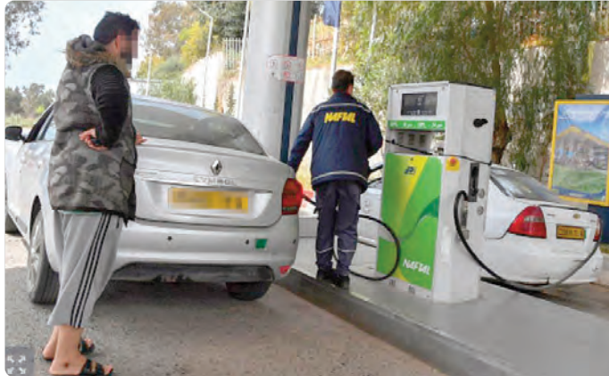
كما أكدت أن الأسعار الجديدة للوقود لا تعكس التكلفة الحقيقية للمنتج (من استخراج، تكرير، نقل) كما أكدت أن الأسعار الجديدة للوقود لا تعكس التكلفة الحقيقية للمنتج (من استخراج، تكرير، نقل) كما أكدت أن الأسعار الجديدة للوقود لا تعكس التكلفة الحقيقية للمنتج (من استخراج، تكرير، نقل)

القُدرة الشرائية ودعم الأنشطة الاقتصادية". وأشارت الوزارة إلى أن الغرض الأساسي من هذه المراجعة للأسعار هو تمكين مؤسسات التكرير والتوزيع من الحفاظ على جاهزية المنشآت وضمان توفر الوقود في كل ربوع الوطن دون انقطاع، وتضادي أي تذبذب مستقبلي في التموين. وأضافت أن الموائد الناتجة عن هذا التحسين ستوجه مباشرة للاستثمار في عصريته محطات الخدمات وتوسيع شبكة البيع بالتجزئة لتقريبها أكثر من المواطنين وتطوير أنشطة التخزين والتوزيع.