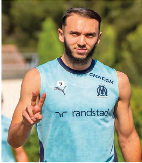
الغياب عن نهائيات كأس إفريقيا للأمم وعلى الرغم من عودته إلى التدريبات بحذر منتصف شهر ديسمبر الماضي، 2025

إلا أن حالته البدنية باتت توصف بالمطمئنة، ما قد يسمح له بالعودة إلى المنافسة في وقت مبكر مقارنة مع ما كان متوقفاً، علماً أنه كان يستهدف في البداية المشاركة في مباراة كأس الأبطال المقررة يوم 8 جانفي، وفقاً للمصدر ذاته.