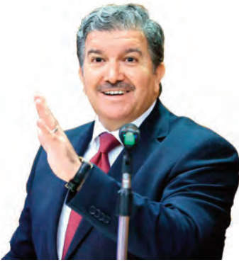
شدد على مد جسور التعاون مع المؤسسات الأكاديمية.. بوعامة: