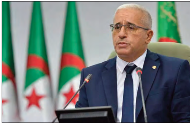
أبرز بوغالي في حوار خص به حصص "الحوار الحقيقي" (Le Vrai Dialogue) بلجيكية "أبييكي"، أن هذا النص يمثل "فعلا سياديا كاملا، نظرا لأن الذاكرة الوطنية مرتبطة ارتباطا وثيقا بالسيادة الوطنية"، مضيفا أنه جاء في إطار التزام ثابت ونضال طويل يقوده النواب، وهو ما يدعو إلى "الفرح بقرار المجلس في حماية الذاكرة الوطنية".

تتمت مغازل مشتركة للجيش الوطني الشعبي بالتنسيق مع مصالح الأمن خلال عمليات نفذت الأسبوع الماضي، عبر مختلف النواحي العسكرية، من إحباط محاولات إدخال مزيد من قناطر من الكيف لاغراض الجرد مع المغرب، حسب ما أوردته أسس، حصيلة عملياتية للجيش الوطني