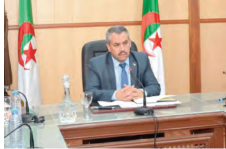
أوضح البيان أن هذه الندوة التي انعقدت مساء الأربعاء، عبر تقنية التحاضر المرئي، بحضور إطارات من الإدارة المركزية، ومديري التربية والمديرين المنتدبين، شدد الوزير على أهمية متابعة مدارس التلاميذ في الولايات المتضررة من التقلبات الجوية، مؤكدا ضرورة تكثيف الزيارات الميدانية للتأكد من جاهزية المؤسسات التعليمية، وضمان التدفئة وإنجاز الترميمات اللازمة، بالإضافة إلى التنسيق مع السلطات المحلية لتأمين النقل المدرسي واستمرارية تقديم الوجبات الساخنة في المناطق النائية.

ترأس وزير التربية الوطنية، محمد صغير سداوي ندوة وطنية متابعة جملة من الملفات ذات الصلة بالسير الحسن للعملية التربوية في ظل التقلبات الجوية التي تشهدها عدة مناطق من الوطن، حسبما أفاد به أول أمس بيان للوزارة.