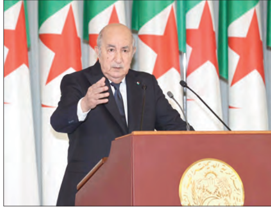
«يأتي في سياق وطني تميز بالمبادرة الهامة التي تطلعت في التعديل الدستوري لسنة 2020، الذي شكل محطة مفصلية في مسار الإصلاحات»

السياسية والمؤسسية وأرسى لأول مرة في تاريخ الجزائر محكمة دستورية، تجسيدا لإرادتنا الواضحة في ترقية العدالة الدستورية وتعزيز دولة القانون. وعليه، يرى القاضي الأول في البلاد أن هذا التحول النوعي أسهم في تدعيم استقلال القضاء وترسيخ مبدأ الفصل بين السلطات وتوجيه آليات الرقابة الدستورية لتعزيز منظومة حماية الحقوق والحريات والضمانات الدستورية للمواطن. وانطلاقا من الاهتمام الذي توليه الجزائر لقضايا القارة والالتزام بالعمل على شخص مساهمها من أجل إيجاد الحلول التي تحقق نهضتها، أكد رئيس الجمهورية أن استضافة الجزائر لدورة المكتب التنفيذي لمؤتمر الهيئات القضائية الدستورية الإفريقية، يأتي في سياق يتماشى مع دورها المحوري في تنظيم تظاهرات ذات طابع قاري، منها معرض التجارة البينية لإفريقيا والمؤتمر الإفريقي للمؤسسات الناشئة، كونها ركيزتين أساسيتين لتحقيق النمو الاقتصادي والابتكار في القارة. واعتبر القطاع بين المبادرتين، يعكس التزام الجزائر بإرساء بيئة إفريقية متكاملة تقوم على دعم الاستقرار والتنمية الاقتصادية من جهة، وترسيخ دولة القانون وتعزيز التعاون في مجال القضاء الدستوري من جهة أخرى، بما يسهم في تحقيق الاستقرار المؤسسي والتنمية