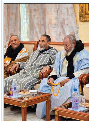
لقاء بين مسؤولي البلدية وممثلي المجتمع المدني

يُتوقع أن تسلم ولاية بومرداس خلال العام الجاري، 3 مشاريع في قطاع الأشغال العمومية، تتمثل أساسا في تدعيم الطريقتين الوطنيتين رقم 5 على مسافة 13 كلم، ورقم 68 على مسافة 11 كلم، في جانب صيانة 4 منشآت فنية على الطرق الوطنية رقم 68 و 29. وتدخل هذه المشاريع ضمن البرنامج الوطني لتطوير وصيانة ودعم شبكة الطرقات، حسبما أعلنت الوزارة الوصية. يُتوقع أن تسلم ولاية بومرداس، حاليا، استكمال أشغال صيانة وتدعيم شبكة الطرق الوطنية والولاية على عدة محاور. وحسبما جاء على الصفحة الرسمية لوزارة الأشغال العمومية على موقع التواصل الاجتماعي "فيسبوك"، يُنتظر أن يسلم 3 مشاريع في قطاع الأشغال العمومية بولاية بومرداس خلال الثلاثي الأول من سنة 2026، تتمثل في تدعيم الطريق الوطني رقم 5 بين النقطة الكيلومترية 000+40 و 000+53 على مسافة 13 كلم، وتدعيم الطريق الوطني رقم 68 بين النقطة الكيلومترية 000+19 و 000+30 على مسافة 11 كلم (الحصتين الأولى والثانية)، إلى جانب صيانة 4 منشآت فنية على الطرق الوطنية رقم 68 و 29. وكشفت الوزارة أن هذه المشاريع تدخل في سياق البرنامج الوطني لتطوير وصيانة ودعم شبكة الطرقات المُعلن عنه مؤخرا. وفي هذا السياق، تشير آخر التحديثات لمديرية الأشغال العمومية ببومرداس، حسب مديرية القطاع، فريال