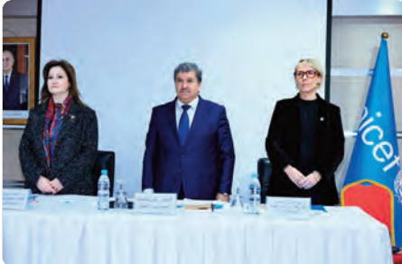
الطفل من معلومة في العالم الرقمي. من جانبه، نوه وزير الاتصال زهير بوعامة، بالجهود التي تبذلها شبكة الإعلاميين والخطوات الهامة التي خلتها نحو تحقيق الأهداف النبيلة التي أنشأت لأجلها، والتي تصب كلها في مجال صون

ب. م. ونجحت في استقطاب جمهور واسع من الأطفال والمربين... (text continues)