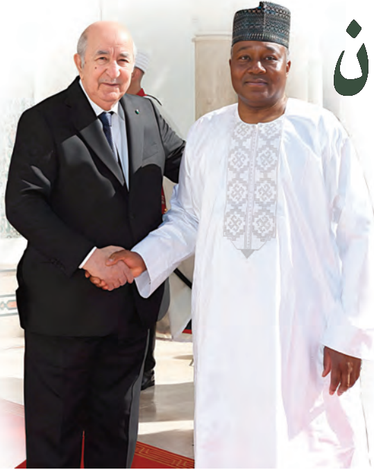
الرئيس تبون والرئيس النيجري يتفان على إعادة تنشيط آليات التعاون الثنائي