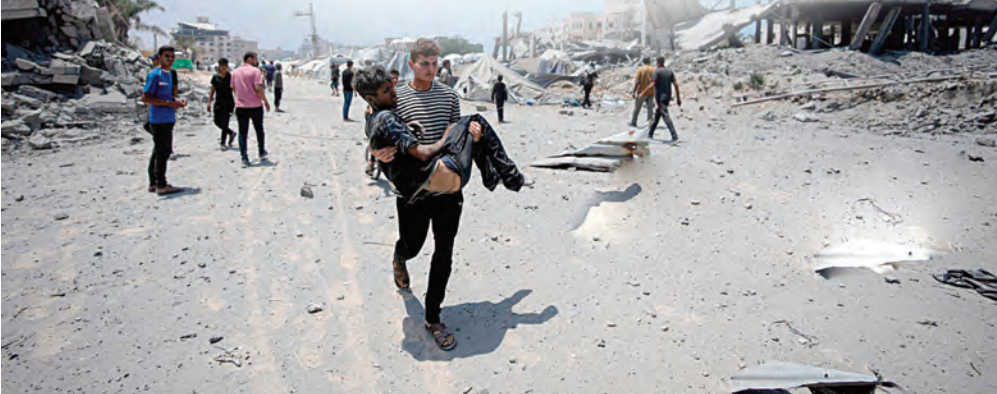
يسمح بالاستيلاء على أراضي الضفة الغربية