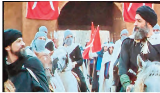
محمد الطاهر زاوي، فخر ومسؤولية كبيرة

سراييد مغلفة، بل كنوز تحتاج إلى لغة العصر، وصورته، وصوته، داعية إلى إنتاج عشرات الأفلام عن رموز الجزائر في مختلف الحقب، من أحمد باي إلى الأمير عبد القادر ولالة فاطمة نسومر ووردة الجزائرية وأسيا جبار، في تعددية رؤى ومقاربات تعكس ثراء التاريخ الوطني.