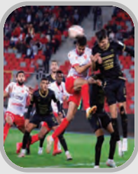
مولودية وهران 2- مولودية الجزائر 1