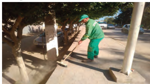
الرجو هو تحسين الإطار المعيشي للمواطن.