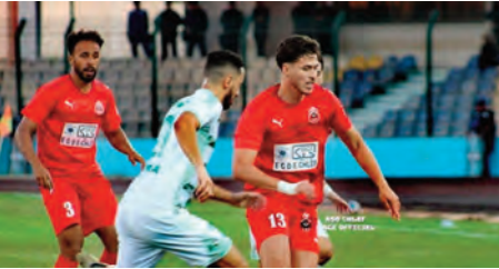
في هذه الواقعة التي كانت صعبة على أصحاب الأرض، الذين عليهم مراجعة الحسابات قبل فوات الأوان بالانظر إلى