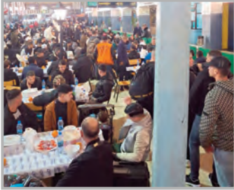
الأطباء بأن تبعد عن حرارة المطبخ.

ومع اقتراب موعد الإفطار تبدأ حركة الشباب المتطوعين دون انقطاع، في جو مليء بالنشاط التضامني، وهو ما وقت عليه "المساء". ولم يبخل الشباب سواء الطلبة أو البالغون بالمساعدة والتطوع في فعل الخير... شباب في عمر الزهور يتقلون بين موائد الإفطار، ويوزعون الأطباق والخبز والمشروبات، من خدمة طالب جامعي وجد راحته النفسية وهو يبذل جهدا في خدمة الغير.