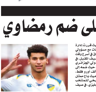
قدم 6 تمريرات حاسمة، فيما لا يزال مرتبطاً بعقد من نادي بارادو، حتى صيف عام 2028.

للنجم الجزائري، حيث حصد 48 بالمئة من إجمالي أصوات المشاركين، متفوقاً بجدارة على منافسه أديان تروفير في مركز الظهير الأيسر.