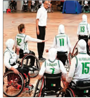
اختبار قوي في ختام الدور التصوي، أمام منتخب جنوب إفريقيا، الذي حقق بدوره العلامة الكاملة حتى الآن.