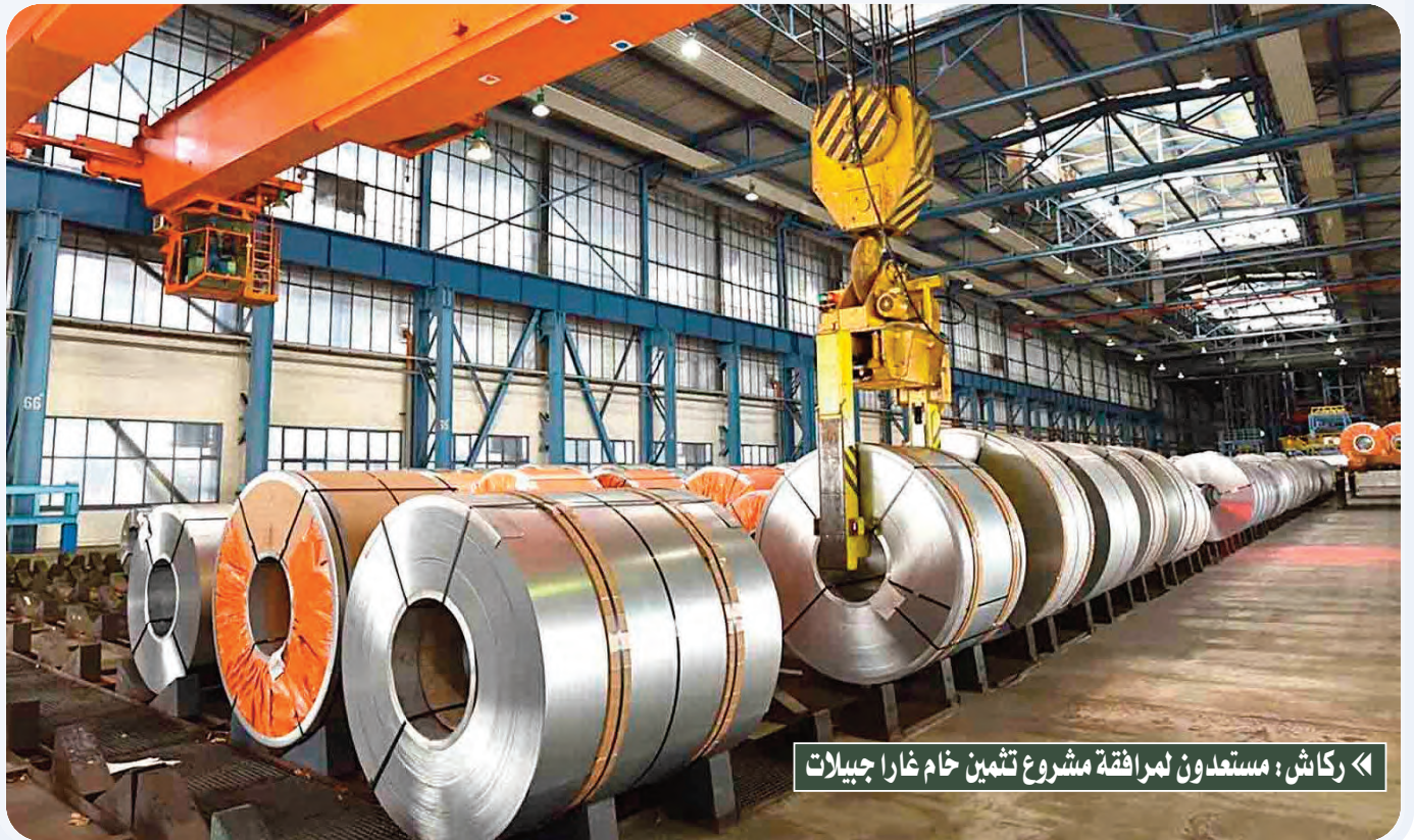
«ركاش: مستعدون لمرافقة مشروع تثمين خام غارا جيبالات

«شي تيانشي: الجزائر وجهة واعدة بالنظر إلى قدراتها الصناعية» الشندولي: الصالون منصة لمد جسور التعاون بين الجزائر وليبيا