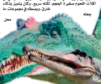
محل جعله العديد من خبراء هذا العالم إلى يومنا هذا.

ولا تقتصر متعة العطلة الريفية على متنزه الصاليات فقط، بل تمتد إلى فضاءات أخرى لا تقل جاذبية، على غرار الحديقة الأيكولوجية ببلدية باب الزوار، التي أصبحت وجهة مفضلة للعائلات الباحثة عن الراحة والترفيه في نفس الوقت، حيث توفر هذه الحديقة أجواء طبيعية هادئة بعيدا عن صخب