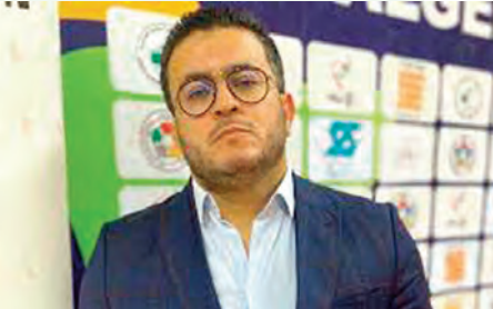
بالقرب الوطني، بعد حصوله على مجموع 09 ميداليات، منها 05 ذهبيات، متبوعاً باتحاد العاصمة برصيد 07 ميداليات، منها 03 ذهبيات، فتادي الجرش في المرتبة الثالثة، بمجموع 04 ميداليات، منها ذهبية واحدة.