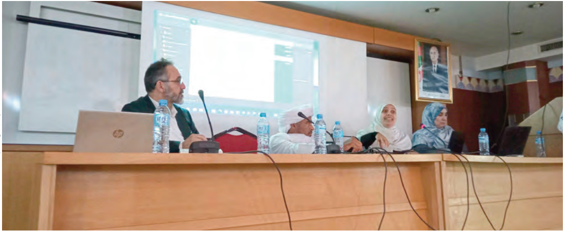
جانبا من الندوة