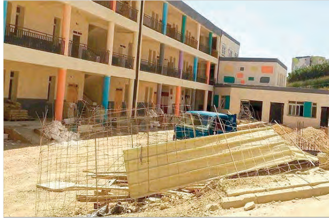
البلدية، والذي بلغت نسبة تقدم أشغاله، 30 بالمائة. إعدادات للمقاولين بالكليوتوس

ومن جهتها، تشهد بلدية الكليوتوس إنجاز مشروع ستة أقسام توسعة بمدرسة أوبوك الرازي المسجل على عاتق البلدية، والذي بلغت نسبة تقدم أشغاله 80 بالمائة، ومشروع إنجاز ستة أقسام توسعة بمدرسة محفوظ درموني، الذي بلغت نسبة تقدم أشغاله 68 بالمائة، ومشروع إنجاز 6 أقسام توسعة بمدرسة "حامد سعد الله"، والذي بلغت نسبة تقدم أشغاله 38 بالمائة. ومشروع إنجاز مجمع مدرسي من 9 أقسام وسكن الزامي بحي الإخوة "كلواز"، الذي بلغت نسبة تقدم أشغاله 68 بالمائة.