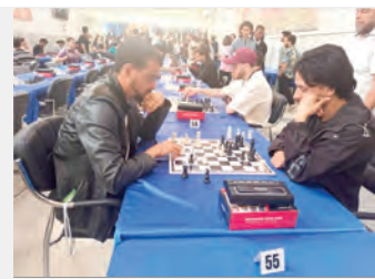
الطلبة العالي، في منافسة تمتد إلى غاية 23 أبريل الجاري. أكد رئيس اللجنة الرياضية للجانمات أن هذه التظاهرة الرياضية تعد محطة حاسمة لاقطاع تأشيرة التأهل إلى

الطالبة، أمس، بمدينة قسنطينة فعاليات طابعها العاشرة من البطولة الوطنية الجامعية للشطرنج، التي تحتضنها جامعة عبد الحميد مهري قسنطينة 2، وسط مشاركة تزيد من 230 طالب يمثلون مختلف مؤسسات