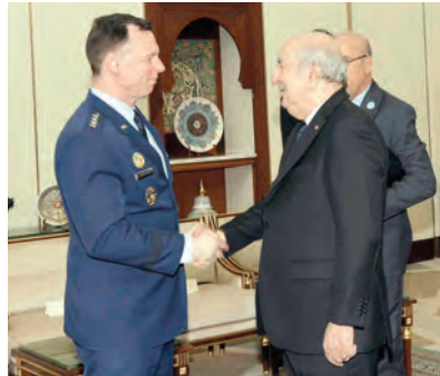
استقبل رئيس الجمهورية، القائد الأعلى للقوات المسلحة، وزير الدفاع الوطني، السيد عبد المجيد تبون، أمس الثلاثاء، نائب كاتب الدولة الأمريكي، السيد كريستوفر لاندو، وقائد القيادة العسكرية الأمريكية في إفريقيا، "أفريكوم"، الجنرال داغفين أندرسون، والوفد المرافق لهما.