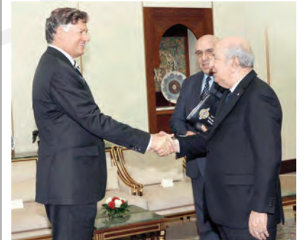
استقبل رئيس الجمهورية، القائد الأعلى للقوات المسلحة، وزير الدفاع الوطني، السيد عبد المجيد تبون، أمس الثلاثاء، نائب كاتب الدولة الأمريكي، السيد كريستوفر لاندو، وقائد القيادة العسكرية الأمريكية في إفريقيا، "أفريكوم"، الجنرال داغفين أندرسون، والوفد المرافق لهما.

قال نائب كاتب الدولة الأمريكي، كريستوفر لاندو، في تصريح للصحافة عقب الاستقبال، إن اجتماعنا مع السيد الرئيس كان ممتازا وغنيا في مضمونه، مستطردا بالقول "تقرفنا كثيرا باستقبال الرئيس لنا، ومن دواعي سرورنا أن نكون في الجزائر، في زيارتنا الأولى إلى هذا البلد الذي أعجبنا كثيرا بجماله وبحفاوة الاستقبال". وأكد نائب كاتب الدولة الأمريكي أن العلاقة بين الجزائر والولايات المتحدة "عميقة جدا"، تعود إلى القرن الثامن عشر وتحتلها إلى سنة 1795 عندما وقع جورج واشنطن، والبابي حسن باشا معاهدة السلام والصدقة، مشيرا إلى أنه "في الوقت الذي تحتفل فيه بالذكرى 250 لاستقلال الولايات المتحدة، نتذكر أن الجزائر كانت من أوائل الدول التي أقامت علاقات دبلوماسية معها، فيما كانت الولايات المتحدة الأمريكية من أوائل الدول التي أقامت علاقات مع الدولة الجزائرية الحديثة، بعد استقلالها سنة 1962". واعتبر لاندو أن البلدين اليوم أمام لحظة مهمة، حيث يمكنهما بعد كل هذه السنوات من استقلال الجزائر التطلع إلى إمكانات هائلة تعود بالنفع على الشعبين الجزائري الأمريكي، من خلال تعزيز العلاقات الاقتصادية والتجارية والعمل معا من أجل مصلحة الشعبين، مبرزا تعدد المجالات المهمة للتعاون بين البلدين، على غرار