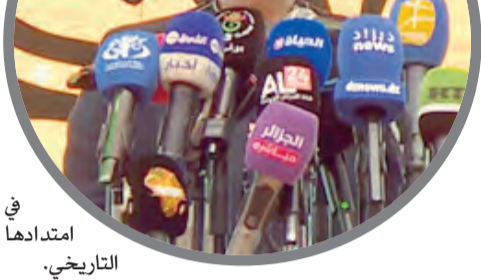
في امتدادها التاريخي.