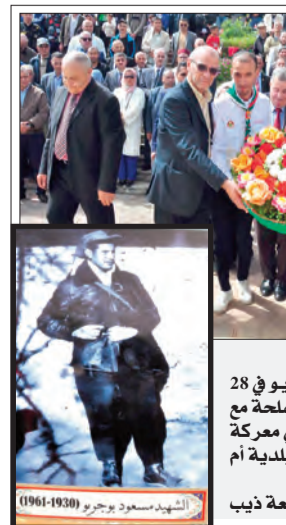
التحرير الوطني سنة 1961. استشهد مسعود بوجريو في 28 أفريل 1961، خلال مواجهة مسلحة مع قوات الاستعمار الفرنسي، في معركة بطولية وقعت بجبل برفون في بلدية أم الطوب بولاية سكيكدة. بوجمعة ذيب