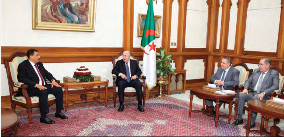
قبل رئيس الجمهورية يعكس "حرص ومكانتها في القارة الإفريقية والدفاع عن قضاياها العادلة"، في حين شدد على أن "التكامل الإفريقي الحقيقي لا بد أن يكون قائما على احترام سيادة الدول"

وعلى ترسيخ مبادئ التعاون وتحسين تنمية شاملة ومستدامة لفائدة الشعوب الإفريقية وهو ما يحرص عليه رئيس الجمهورية. وأوضح رئيس البرلمان الإفريقي أن "الجزائر اليوم، تحت قيادة رئيس الجمهورية، تؤكد التزامها الثابت بمرافقة الدول الإفريقية ودعم كل جهود السلم والتنمية والحوار والتكامل". وذلك انطلاقا من "إيمانها العميق بأن مستقبل إفريقيا يبني بوحدتها وبشراكة واعدة وعادلة متوازنة تحفظ كرامة الشعوب ومصالحها".