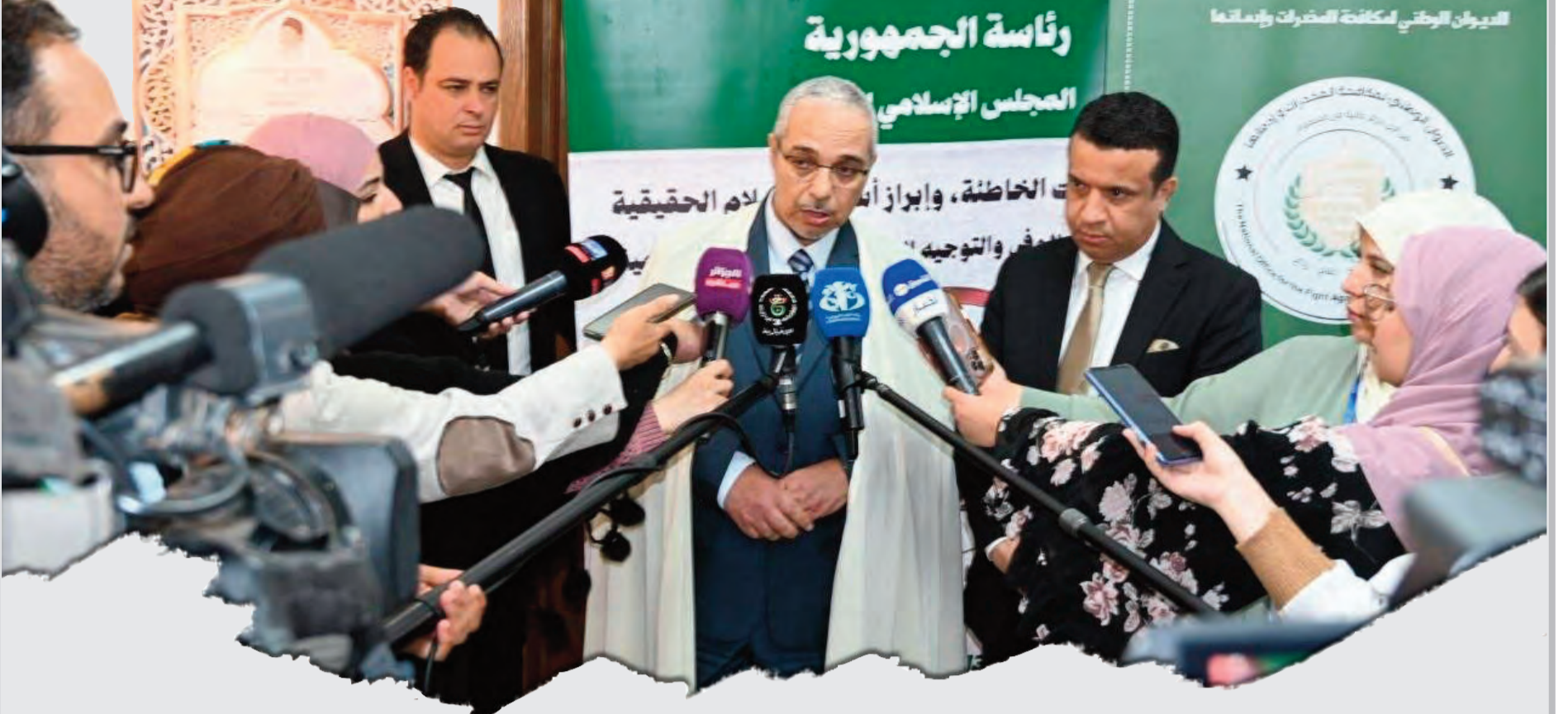
الديوان الوطني لمكافحة المخدرات وإدمانها