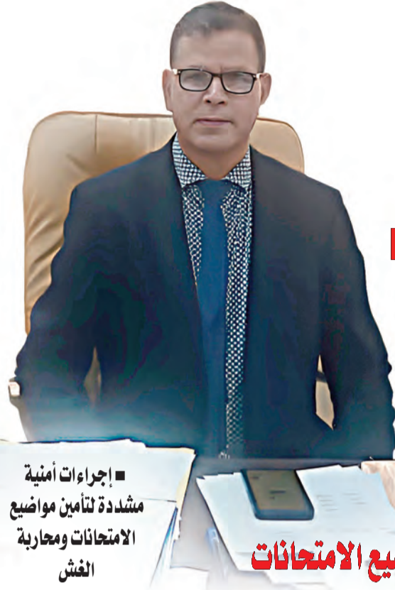
■ إجراءات أمنية مشددة لتأمين مواضيع الامتحانات ومجاربة الغش