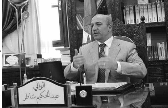
الاعمال بالمنشآت البلدية