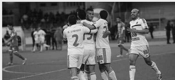
الخروج من هذه الوضعية ما لم يعمل الجميع لصحة النادي الشلفي المقبل على جولات ستكون صعبة، حيث سيستقبل في الجولة القادمة 131 ومو ما آخر كثيرا على منويات الفريق ومن الصعب

اتحاد بلعباس لم ينتقل إلى العاصمة لمواجهة نصر حسين داي في الجولة ما قبل الأخيرة لمرحلة الذهاب ليختمتها بلقاء مثير على أرضية ملعب محمد بومزمار، حينما يستقبل اتحاد العاصمة بطل الشلف، لكن في المقابل بإمكان أولمبي استعادة توازنه في حالة الفوز على المواجهات التي يستقبل فيها وعلى أرضية ملعب محمد بومزمار، والديانة بلقاء الفد المتأخر أمام النسر الأسود ثم اتحاد بلعباس وبعدما اتحاد العاصمة وقبلها العودة بنتيجة إيجابية من العاصمة وأمام النصر، وكذا بتتبع مهمة في حالة العكس فالأمر يستبعد أكثر ومن الصعب العودة والهروب من المنطقة الحمراء، ومعها تزداد معاناة ومشاكل التشكيلة الشافية، للتذكير فقط فإن هزيمة الفريق الشلفي أمام مولودية العلة بالعلامة تعد الخامسة بعد الجولات التي لعبها الفريق لحد الآن، في انتظار باقي الجولات، لعل يسعي الشافرة إلى إعادة التوازن واستقرار في النتائج بالنظر إلى منتظر الشافلا من لقاءات الجولات المقبلة كمنظرة لاجابة عن كل التساؤلات وللحديث بقية.