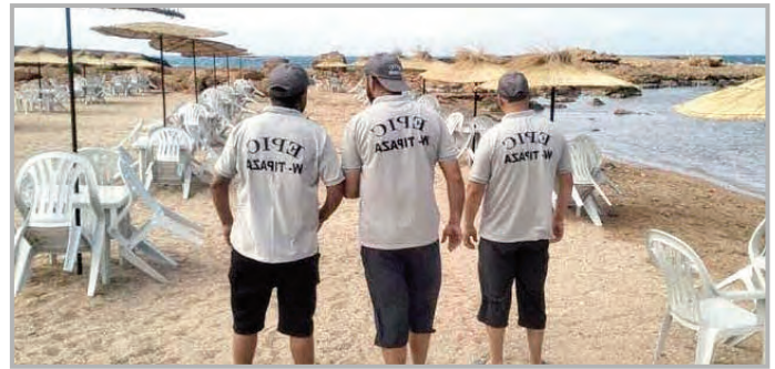
شاطئ "تنوعات كوالي" بتيبازة