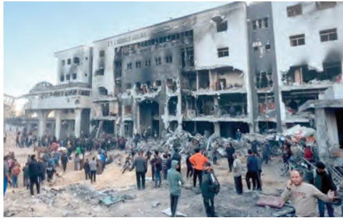
عدد من الخدمات خلال أيام في مجمع الشفاء وبقيت مستشفيات القطاع. وأشار المسؤول الصحي الفلسطيني، إلى أن غزوة لا تزال محدودة جدا مقارنة بحجم الاحتياج موضعا وجود نحو 350 ألف مريض مزمن في قطاع غزة من بينهم حوالي 11 ألف