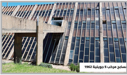
مسبح مركب 5 جويلية 1962