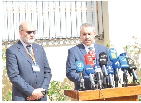
الموضوعية والإنصاف لجميع المترشحين. وعلى صعيد متصل، نوّه الوزير بالمستوى الراق الذي تميزت به