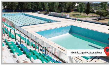
مسبح مركب 5 جويلية 1962